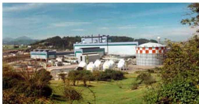
Se han planteado medidas para facilitar el cumplimiento de las obligaciones tributarias de las distribuidoras y comercializadoras de gas

En la exposición de motivos se añade que en relación con los rendimientos derivados de las figuras tributarias establecidas se deberán adoptar los criterios oportunos para que los mismos reviertan con especial intensidad