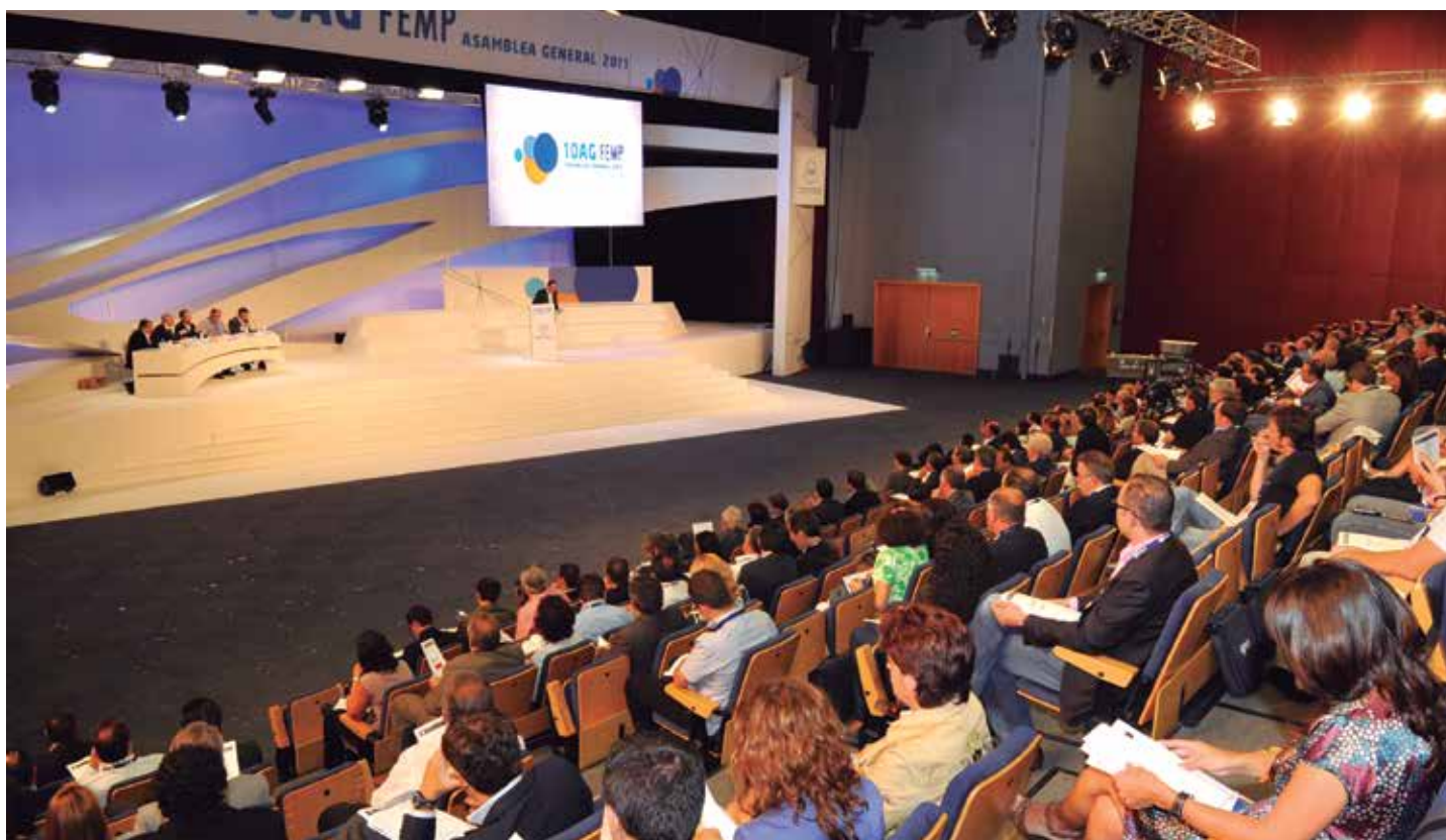
Plenario de la X Asamblea General, celebrada en 2011.

El Pleno es el órgano soberano de la Federación y se reúne, de forma ordinaria, una vez cada cuatro años. Es en este foro, al que están llamados a participar todos los miembros de la Federación, donde se diseña la "hoja de ruta" que marcará el trabajo a desarrollar durante el siguiente mandato de cuatro años y se determina la composición de los órganos de Gobierno de la FEMP (Consejo Territorial, Junta de Gobierno y Presidente) en función de la representación que las diferentes opciones políticas hayan obtenido en los municipios y provincias españoles.